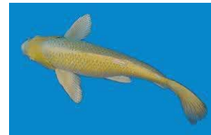
ヒレナガニシキゴイ

「キングヨ」や「ニシキゴイ」など みてたのしむさかなを そだてて うっ ています。さかなのいろやもよう おお きさやかたちなど さまざまな さかな に そだてています。