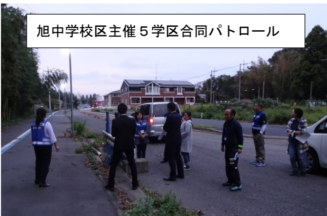
旭中学校区主催5学区合同パトロール