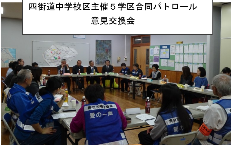
四街道中学校区主催 5学区合同パトロール 意見交換会

各学校とも、教員の参加人数が十数人にもものぼり補導委員よりも多い時もあり、全面的に協力して頂いております。