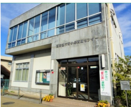
四街道市青少年育成センター