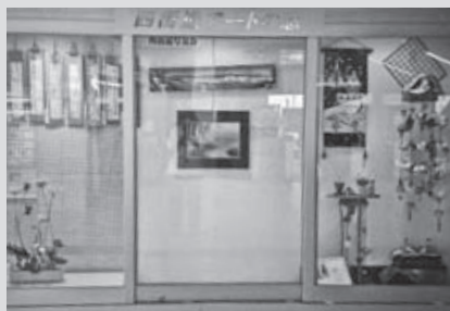
「四街道アートの窓」全景