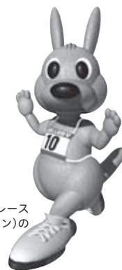
ワラビー 四街道ガス灯ロードレース 大会(ワラビーマラソン)の マスコットです

編集と発行／四街道市教育委員会 〒284-0003 千葉県四街道市鹿渡2001-10 (市役所第二庁舎2階) ☎421-2111 (代)