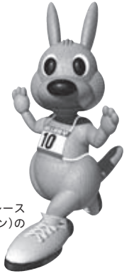
ワラビー 四街道ガス灯ロードレース 大会(ワラビーマラソン)の マスコットです

編集と発行／四街道市教育委員会 〒284-0003 千葉県四街道市鹿渡2001-10 (市役所第二庁舎2階) ☎421-2111 (代)