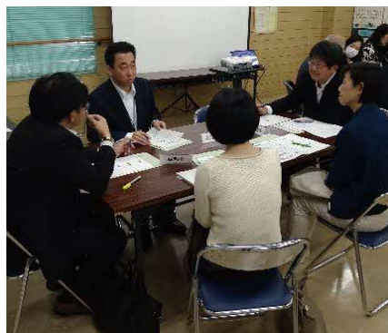
地域コーディネーター会議 (グループ協議)