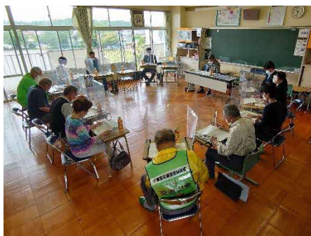
学校支援推進会議