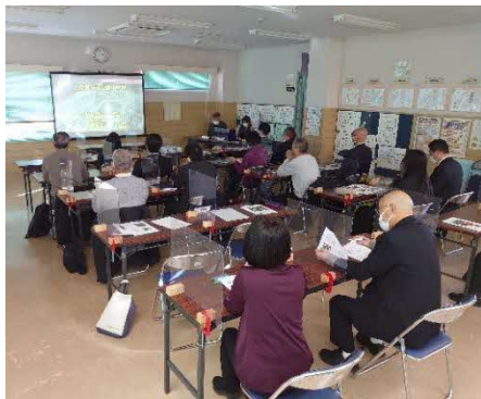
地域コーディネーター会議