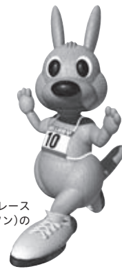
ワラビー 四街道ガス灯ロードレース 大会(ワラビーマラソン)の マスコットです

編集と発行／四街道市教育委員会 〒284-0003 千葉県四街道市鹿渡2001-10 (市役所第二庁舎2階) ☎421-2111 (代)