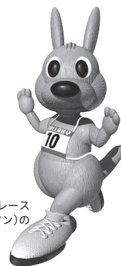
ワラビー 四街道ガス灯ロードレース 大会(ワラビーマラソン)の マスコットです

編集と発行／四街道市教育委員会 〒284-0003 千葉県四街道市鹿渡2001-10 (市役所第二庁舎2階) ☎421-2111 (代)