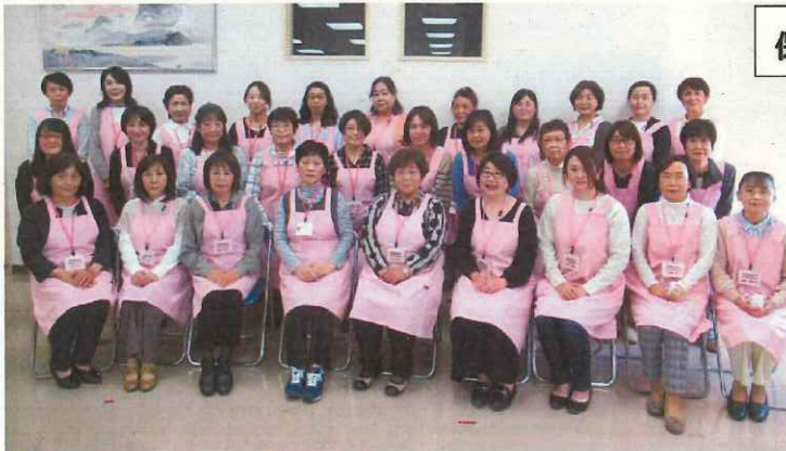
保健推進員委嘱状交付式（4月23日）