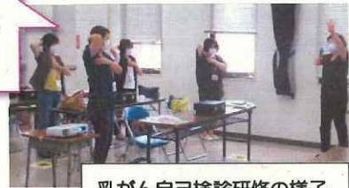
乳がん自己検診研修の様子