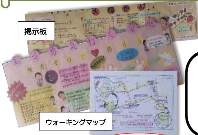
ウォーキングマップ