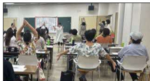
ロコモティブシンドローム予防にロコモ体操を練習

詳しくは、市政だより（9月1日号）、市ホームページ、地区回覧等でお知らせします。