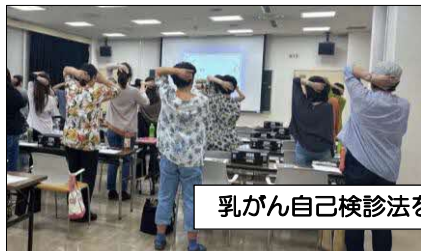
乳がん自己検診法を学ぶ