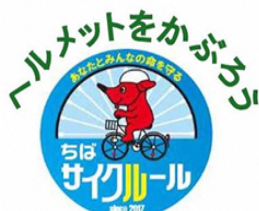
千代田地区3校みんな子育ての会では自転車ヘルメットの着用強化に取り組んでいます。