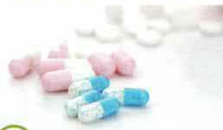
② 医薬品の多量摂取