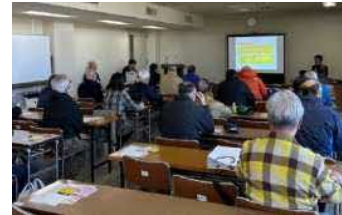
四街道警察署警察官による講習状況