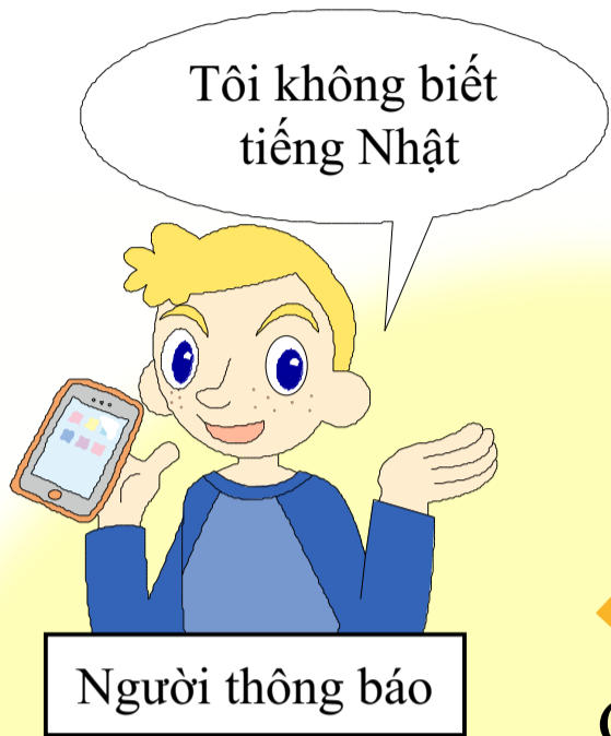
Người thông báo

Khi bạn gọi số 110 tại tỉnh Chiba thì sẽ được kết nối tổng đài trung tâm tiếp nhận cuộc gọi khẩn cấp của Tổng bộ cảnh sát tỉnh Chiba.