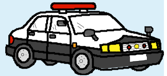
Xe tuần tra