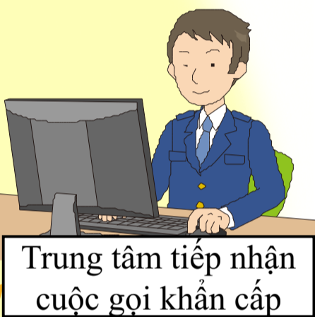
Trung tâm tiếp nhận cuộc gọi khẩn cấp