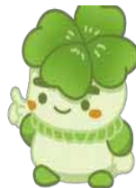
千葉県子どもと親のサポートセンター

<千葉県子どもと親のサポートセンター住所> 〒263-0043 千葉市稲毛区小仲台5-10-2 千葉県子どもと親のサポートセンター 支援事業部 電話 043-207-6028