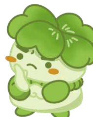
千葉県子どもと親のサポートセンター マスコットキャラクター こさぼん