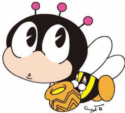
生涯学習イメージキャラクター「マナビィ」