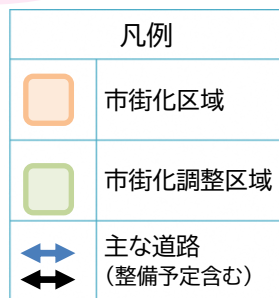
土地利用のイメージ図

この地域は、今後も市の発展を主導する重要な地域であることから、地域の魅力向上に向けた土地の有効活用を促進することにより、多様な機能との相乗効果を創出し、さらなる発展を目指します。