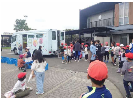
栗山小学校での巡回の様子。 多くの子どもたちが利用しています。

今後の展望： 令和 8 年度もさらなるステーション追加を検討中であり、公共図書館が「自ら出向く」ことで、利便性の高いサービスを提供してまいります。