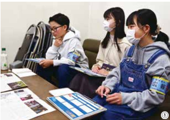
▲左からいぶぎ記者、あやの記者、まお記者