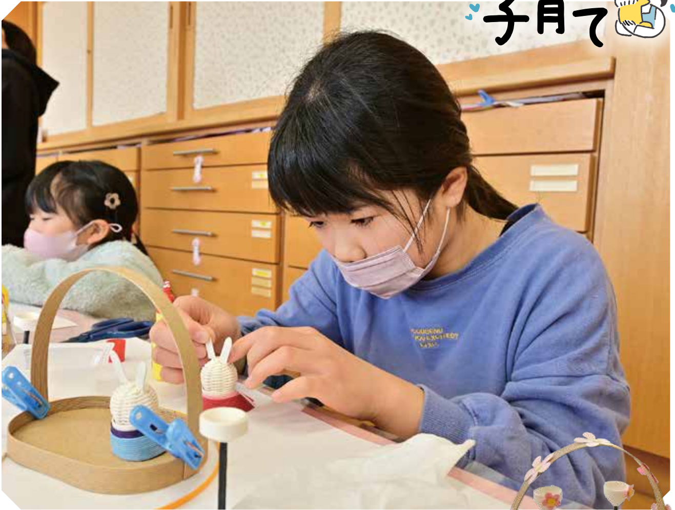
わろうべの里児童センターで行われた「わろうべ工作」の様子です。 今年の干支をモチーフにした「うさぎのおひなさま」を作りました。 うさぎの顔を真剣な表情で作っていました。かわいい「おひなさま」が完成しました。