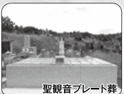
聖観音プレート葬