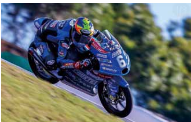
▲2020年11月 ウィンターテストポルティマオサーキット