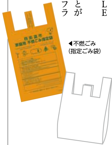
◀不燃ごみ（指定ごみ袋）