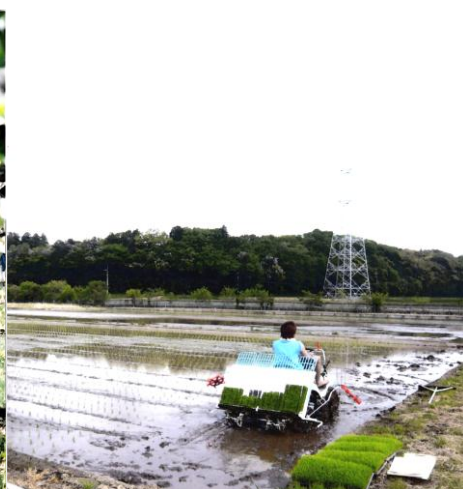
田植え風景（長岡地区）