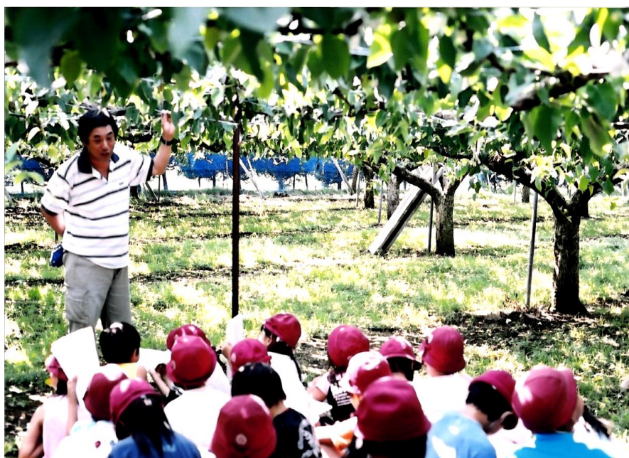
児童による梨園見学（大日地区）

発行/四街道市農業委員会 ☎/421-6155 編集/農業委員会だより編集委員会