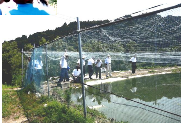
農業委員会視察研修（ホノモロコ養魚場）