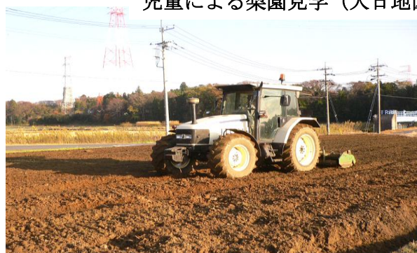
ヘアリーベッチ耕運（長岡地区）