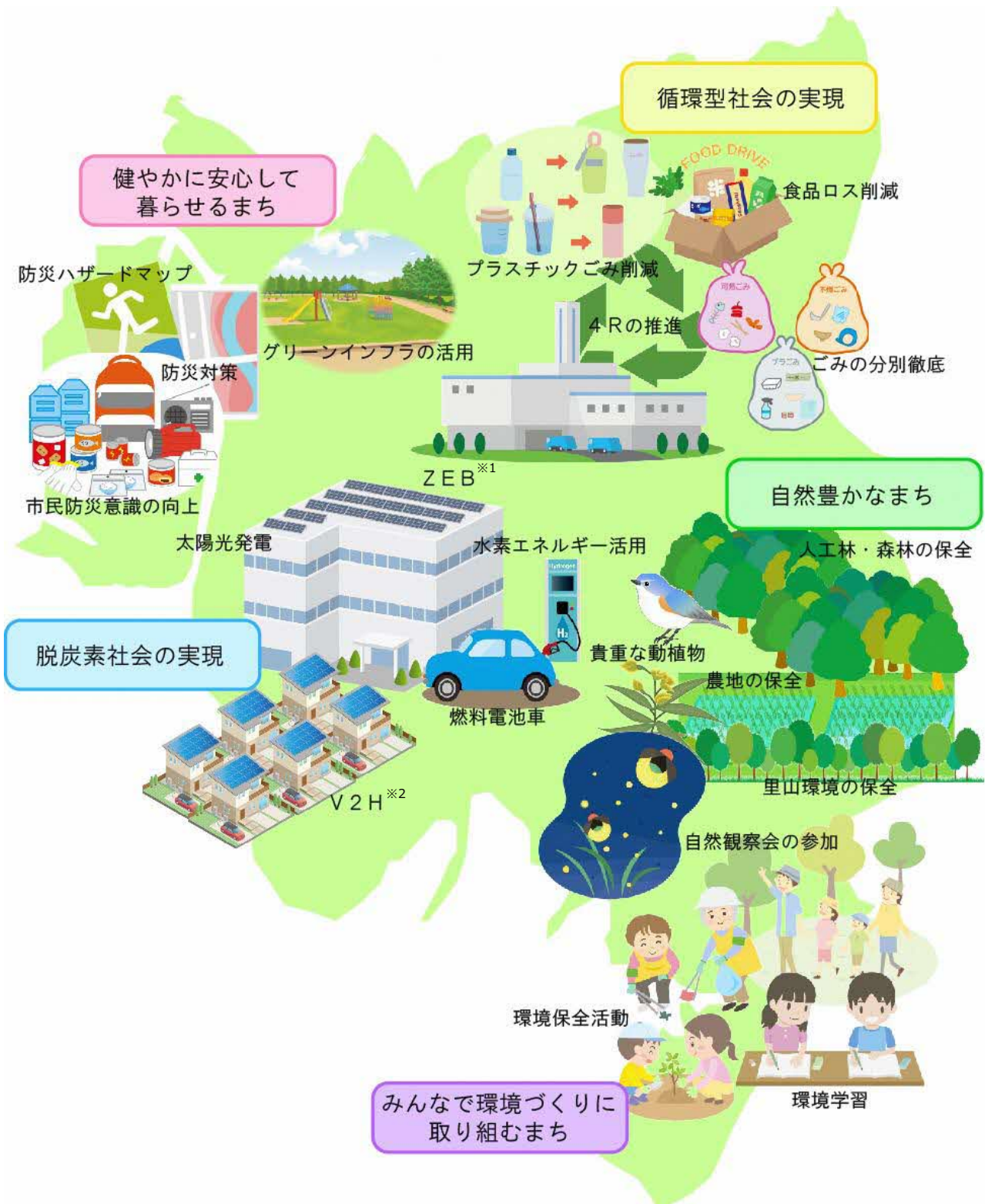
図表 3.3 四街道市の将来イメージ図